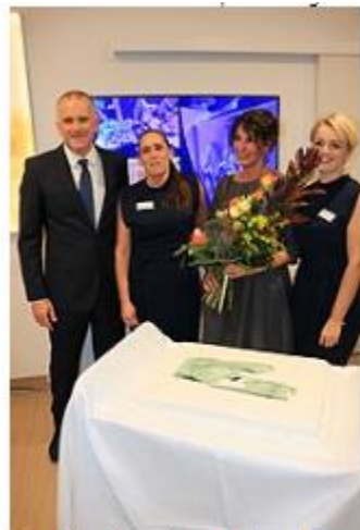
Nach der Einweihung gab es Torte für Alle

Bereits seit dem 10. Juli 2019 ist der neue Varian TrueBeam mit iterativer Bilderkennung im Einsatz und übertrifft alle Erwartungen. Patienten profitieren von hoher Bestrahlungspräzision, weniger Nebenwirkungen und kürzerer Bestrahlungszeit.