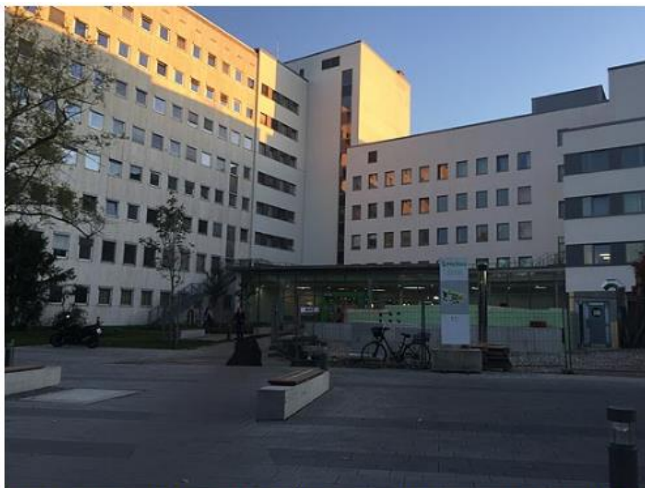
Rechts vor dem Hauüteingang der Helios Klinik Pasing wurde in den Boden versteckt das neue Varian True Beam in einem neuen, unterirdischen Gebäudeteil errichtet.

Steinerweg 5 81241 München Tel.: 089 88922357